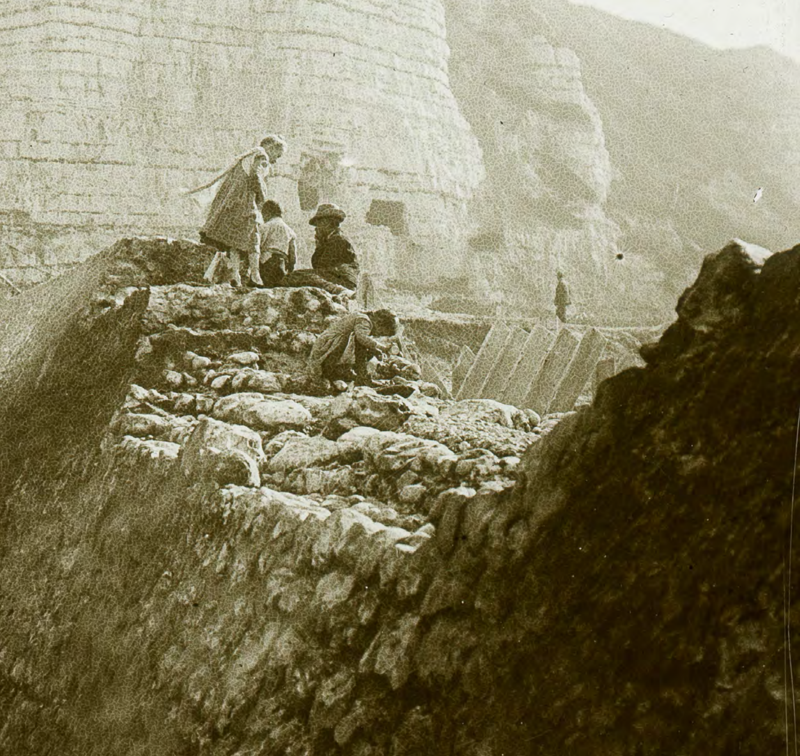
Robert Demachy, Groupe au pied des falaises à Yport, 20 ème siècle