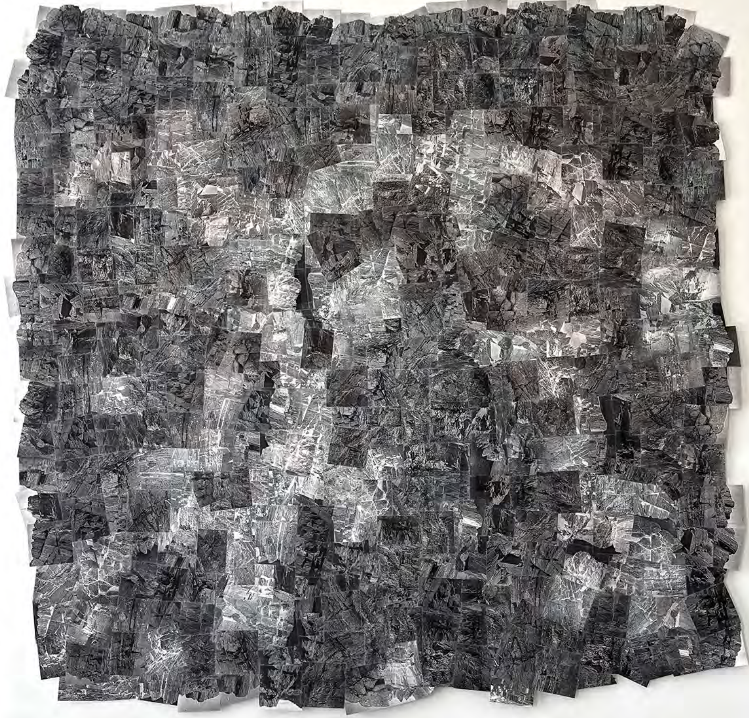
Eugenie Shinkle, Middle Cove Beach, (Mulhouse Variant), 2026