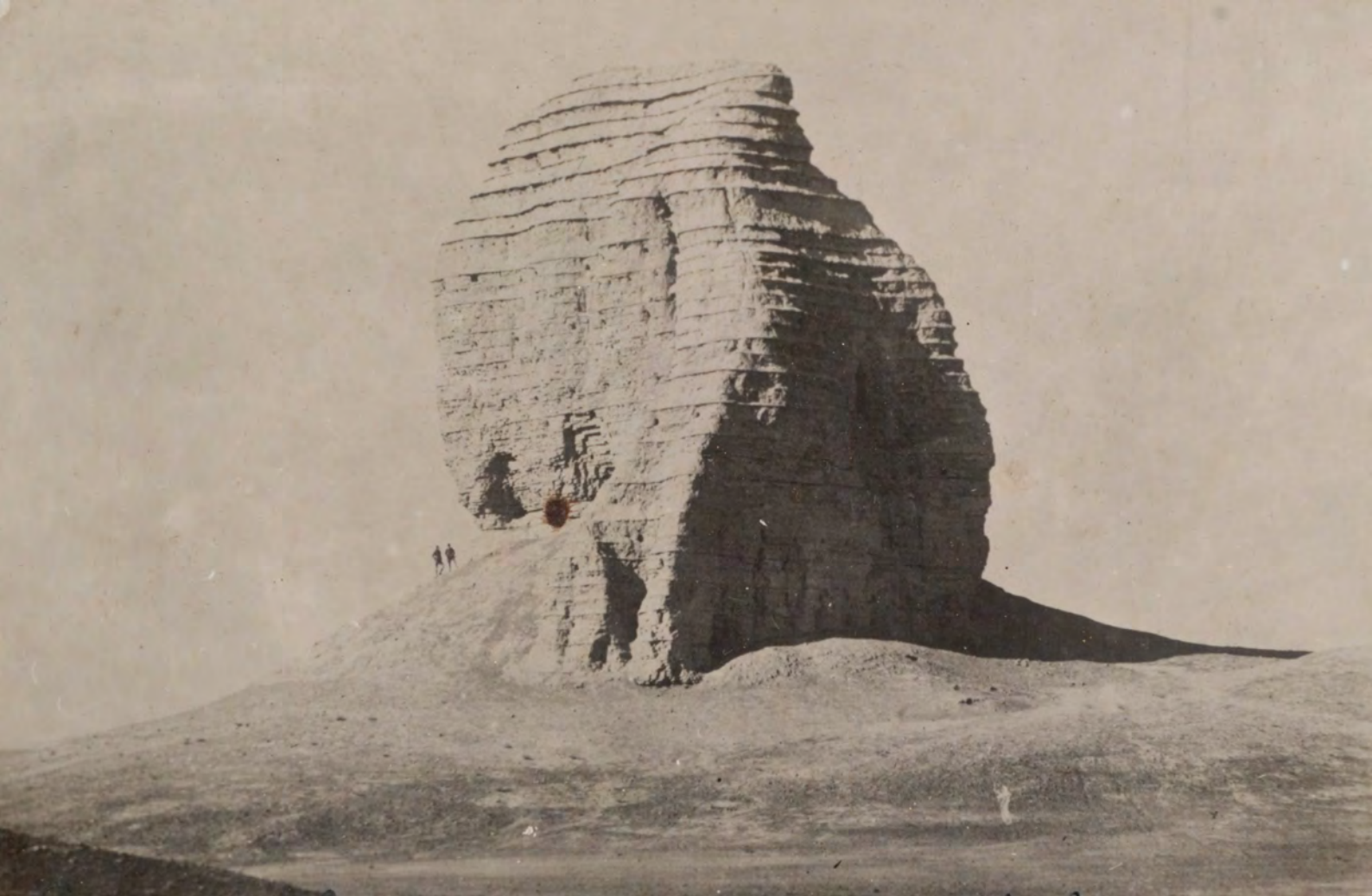
Anonyme, Le monolithique près de Bagdad, datant du VI e siècle avant J.C., vers 1924-1926