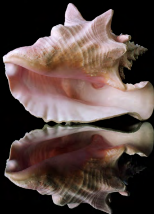
Roselyne Titaud, Lobatus gigas , vue ventrale +90° de la série Cosmologies , 2024