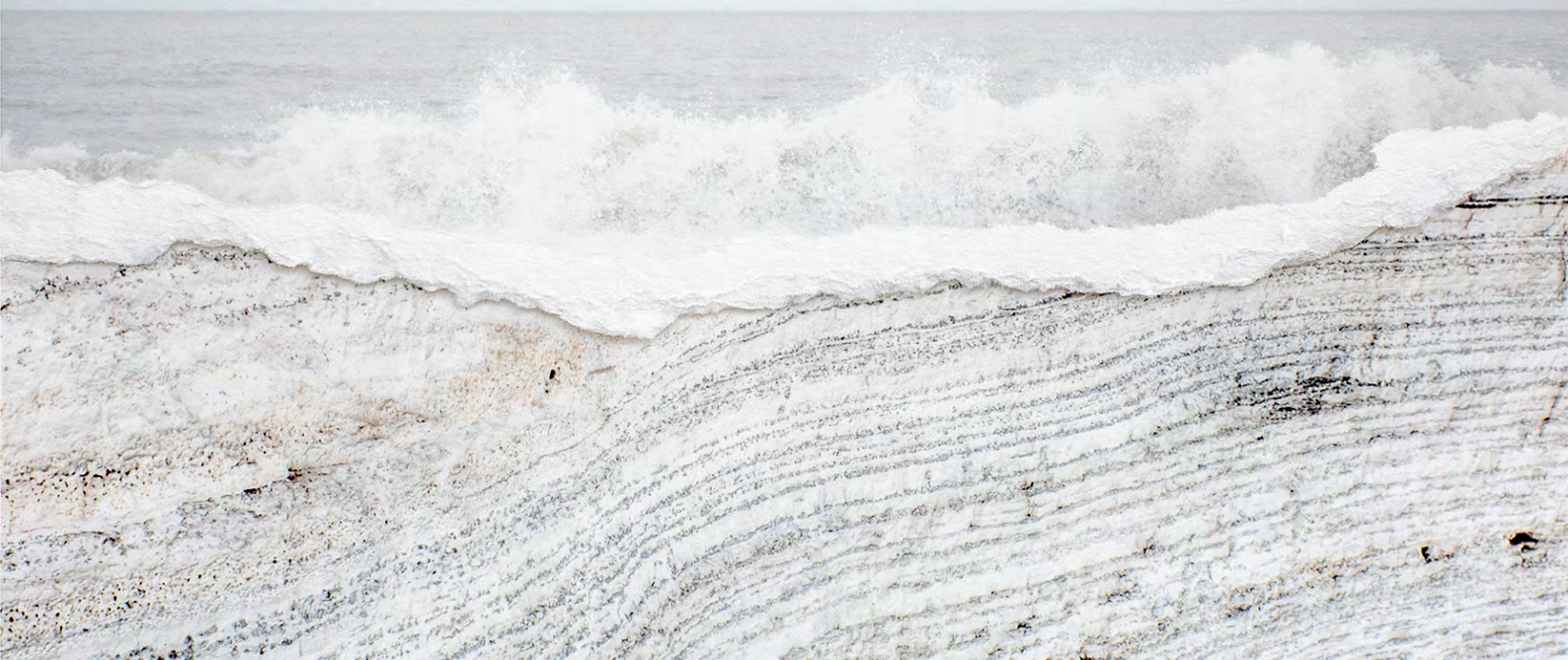
Marilia Destot, Sédimentations , de la série Memoryscapes , 2025