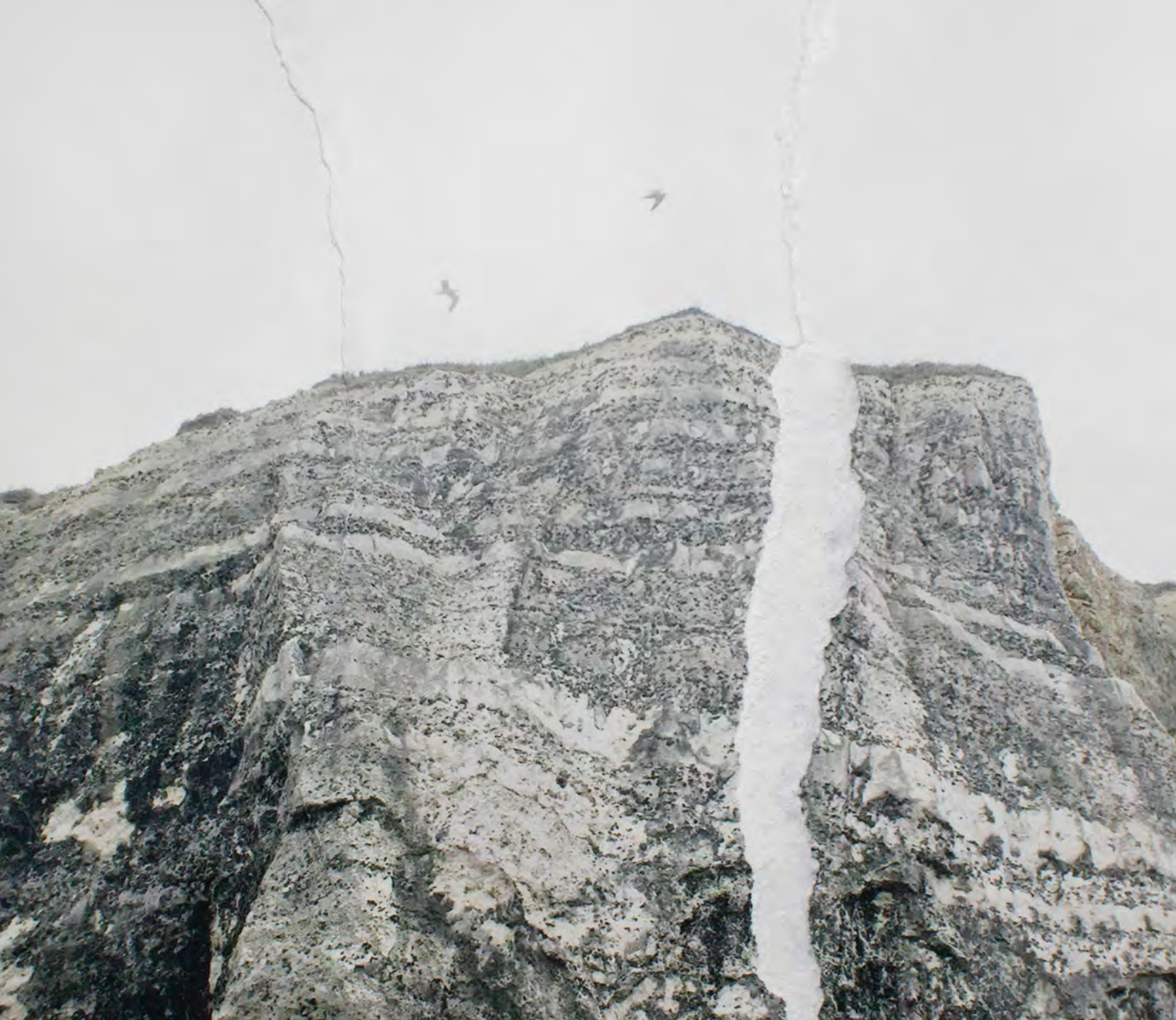
Marilia Destot, Falaise de la série Memoryscapes , 2025